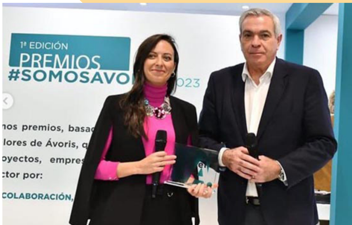
La directora general de Grupo GEA recoge el premio a cargo del director general de tour operación de Ávoris.